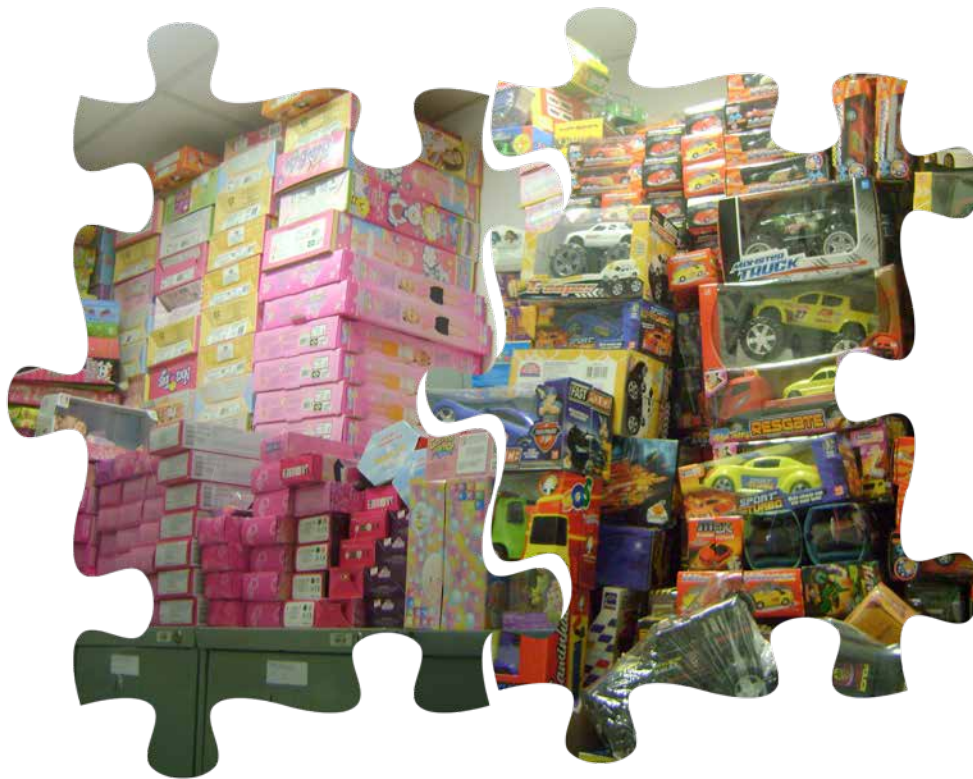
Arrecadação de brinquedos em ação realizada pelos graduandos de Psicologia no 2º semestre de 2013

A Instituição também destaca uma série de eventos e projetos que beneficiam àqueles que a cercam.